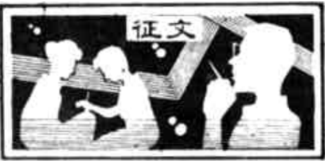
暑假大学生社会实践活动

东营，我的年轻的城市，开发黄河三角洲已成为山东两大跨世纪工程之一。未来的港口必将更壮美，成为你腾飞的金翅。